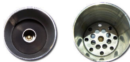
Ø 55 mm

Unsere spezielle Düsenteknik bewirkt eine hohe Hitzeleistung und führt die Flamme gezielt auf das Material.